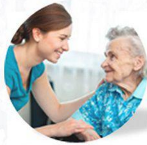
Gestion des prises en charge