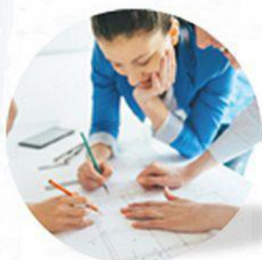
Planning des interventions