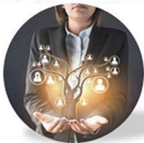
Gestion de la Relation Client